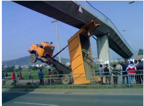
ምስል 4.2 የተሽከርካሪ አደጋ

እርምጃዎቻችሁን አስተውሉ፣ ጠንቀቅ በሉ፣ አስቡ፣ ከዚያም ፈጽሙ።