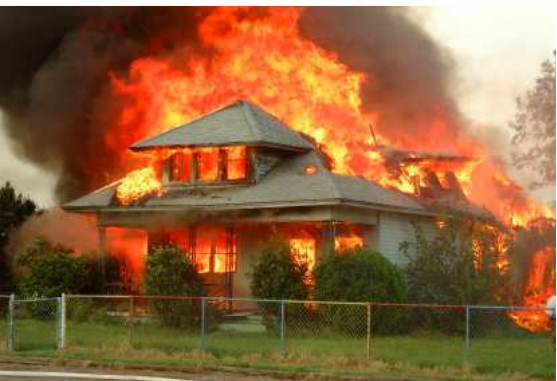
ምስል 4.3 የእሳት አደጋ

ለማቀዝቀዝ በውኃ መንከር፣ ያስፈልጋል። እንደዚሁም የእሳት አደጋን እርዳታ ለማግኘት ስልክ ደውሉ።